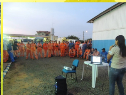
Palestra ministrada aos colaboradores do canteiro de obras da Sanches Tripoloni, em Brasil Novo - PA