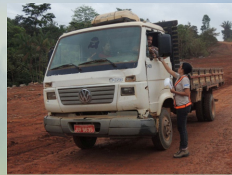
Ação educativa realizada no trecho em obras do município de Medicilândia- PA

OUTUBRO ROSA. A Gestão Ambiental BR-230/422/PA aderiu à Campanha Outubro Rosa. O Outubro Rosa é um campanha de conscientização realizada por diversos entes, no mês de outubro. É dirigida à sociedade, e principalmente às mulheres sobre a importância da prevenção e do diagnóstico precoce do câncer de mama. O movimento começou a surgir em 1990 na primeira Corrida pela Cura, realizada em Nova York, e, a partir daí, passou a ser promovida anualmente na cidade. Somente em 1997 as entidades das cidades de Yuba e Lodi, também nos Estados Unidos, começaram a promover atividades voltadas ao diagnóstico e prevenção da doença, escolhendo o mês de outubro como epicentro das ações. Atualmente, o Outubro Rosa é realizado em vários países. (J.O.)