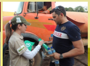
Atividades educativas realizadas nas proximidades da balsa que dá acesso aos municípios paraenses, sentido Marabá