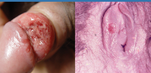
SÍFILIS NO HOMEM E NA MULHER